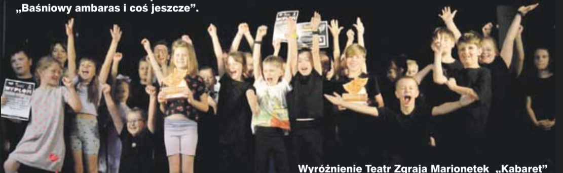
Wyróżnienie Teatr Zgraja Marionetek „Kabaret”

Nagroda główna ex aequo – Teatr Asy z II klasy za spektakl „Lokomotywa” i Teatr Dzieciaki z II c za spektakl „Baśniowy ambaras i coś jeszcze”.