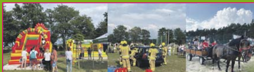
Dzień Dziecka przy Wigwamie w Siedlcu