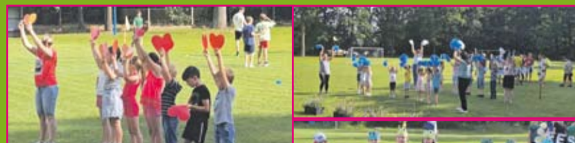
Festyn Rodzinny w Belęcynie