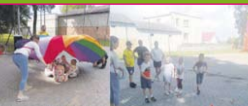
Dzień Dziecka w Kietpinach