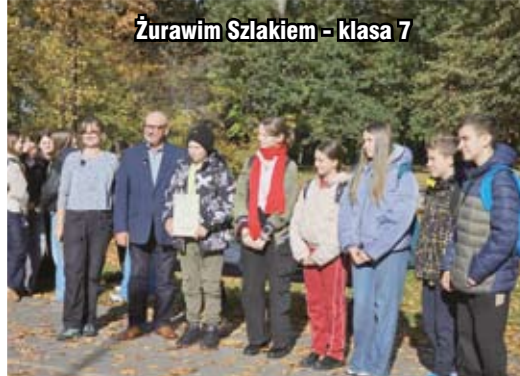
Żurawim Szlakiem - klasa 7